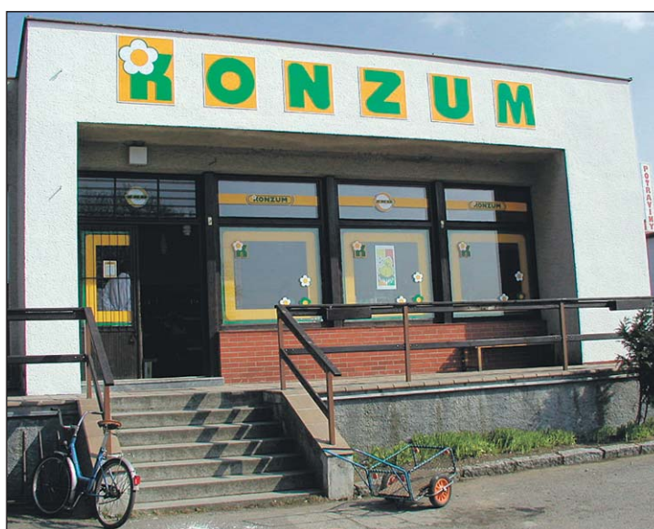
KONZUM ve Svěradicích (obr. nahoře) a v Bezděkově (obr. vlevo) - zprovozněny v roce 2002.

stava a rychlému vývoji na trhu rychloobrátkového zboží je obtížné popsat všechny události let 2002-2004. Obecně lze říci, že toto období přispělo ke stabilizaci družstva, k růstu výkonů a zlepšení jeho organizace. Výhodou a základem dobrých výsledků byla i stabilizace u vrcholových orgánů družstva ve kterých