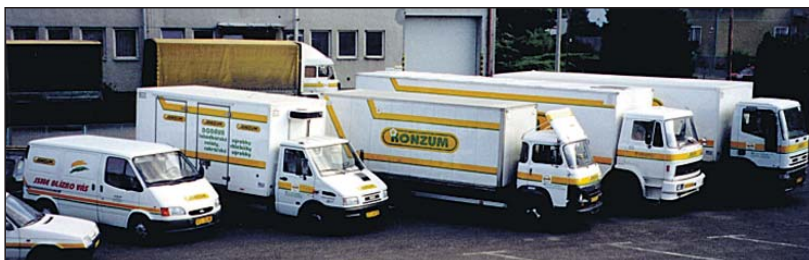
Část flotily vozidel ZKD Sušice v roce 2002.

náměstí, opravu sociálního zařízení hotelu Beránek, plynofikaci prodejen ve Švihově a Plánici, rekonstrukce prodejen Kašperské Hory, Sylvánov, Sušice náměstí a v neposlední řadě zahájení projektu instalace klimatizací v prodejnách. Druhou oblastí kam bylo vždy nutné směřovat nemalé výdaje je vozový park v rámci koncepce vlastní autodopravy. Celkově je v družstvu více jak 100 vozidel a skladových vozíků, které