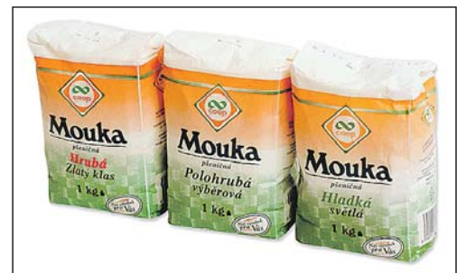
Původní vzhled privátních značek skupiny COOP.

Od roku 2000 se začaly na našem trhu objevovat tzv. „privátní značky“ (dále PZ), které byly vyráběny pro ten který obchodní řetězec s cílem vypěstovat věrnost zákazníků a nabídnout levnější zboží za srovnatel-