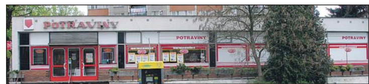
Prodejna COOP TUTY v Klatovech, Kollárova ul. otevřená v roce 2005 (srovnání 2005 a 2011).

dejen bývalé Jednoty Sokolov v roce 2004 přesáhl jejich roční obrat více než miliardu korun a za období 2005-2007 činil 3,2 miliardy korun. Otevřeny byly nové prodejny: Kollárova ulice Klatovy, Diskont Horšovský Týn, Ujčín, Újezd u Domažlic, Čechelovice, Bublava, Javorná, Mnichov, Újezd