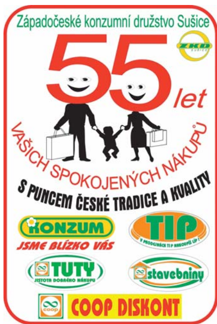
29.1. 2006 oslavilo ZKD Sušice 55. výročí od svého založení