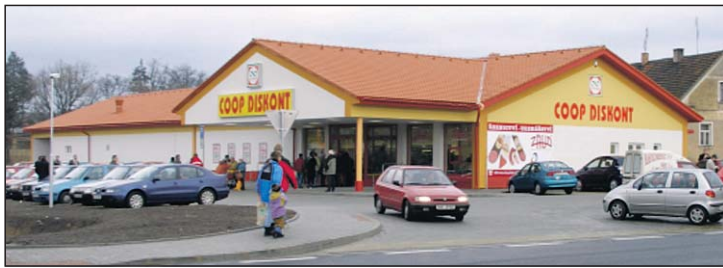
COOP Diskont v Horšovském Týně otevřený v roce 2005.

► s názvy KONZUM, TUTY, TIP, Diskont a Stavebniny. Každým rokem byla prováděna celá řada remodelingů, vybavování novým zařízením a nově byl zahájen projekt klimatizací a instalování elektronických ochranných objektů. Dnes je toto zařízení na více než 50 prodejnách. Další obchodní aktivitou byla velkoobchodní činnost ve skladech v Sušici (potravinářský a nepotravinářský sortiment) a v Kolinci (ovoce a zelenina). Jejich