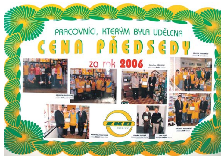
Oceňování nejlepších zaměstnanců udělováním „Ceny předsedy“.

majetku, který v letech 2005-2007 dosáhl částky 45 milionů korun. Prodáno bylo například: hotely Beránek v Klatovech a Družba v Domažlicích, bývalá škola v Rejstějné, staré stavebniny v Sušici, bývalá průmyslová prodejna v Kašperských Horách a část areálu bývalého velkoobchodu v